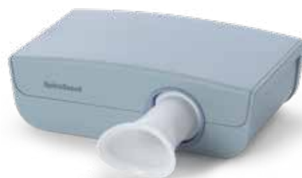
Spiromètre à ultrasons SpiroScout SP plus

L'option spirométrie propose des mesures CVF, CVL et VMM avec un large choix de normes de référence, de tests préalables et postérieurs ainsi que l'interprétation des résultats CVF. L'appareil fournit un feed-back sur la qualité de la procédure pendant le test et après chaque essai. Un écran de motivation est inclus pour les tests avec des enfants.